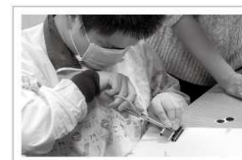
▲用手先確認水龍頭的構造，小學員神情專注。

一般明眼人在水電損壞時，可透過視覺嘗試了解其構造與維修方式，但對視障者來說，卻很難在毫無準備的情況下獲取這些資訊，然而這同時又是生活中每個人都會遇到的課題。這次視障孩子們跟著愛盲來到特力屋擔任小小店長，更換燈泡、電鑽鎖螺絲、蓮蓬頭拆卸組裝樣樣來，還第一次站到收銀台模擬為客人服務，特別的體驗讓大家覺得既驚奇又新鮮。