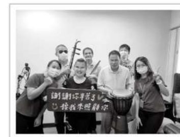
▲艾瑪絲關心愛盲視障夥伴的健康，特地來為愛盲樂團的成員們進行頭皮健檢。

原來從頭皮也可反映出平常的生活作息及身體狀況，像是從前額頭皮淺淺的血絲，判斷出平常有熬夜的習慣，或是從後腦勺的油脂判斷久坐辦公室的問題，聽著養護師的說明，團員們嘖嘖稱奇，也重新認識到頭皮清潔的重要性及正確的清潔步驟，大家都受益良多呢！