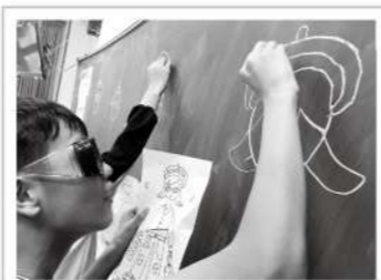
▲戴上模擬眼鏡，與同學共同協力完成圖畫中的人物，感受視野受限的不便。

對於「視覺障礙」，許多人第一時間聯想到的是不是一片漆黑的景象呢？愛盲在丹鳳高中黃老師的邀請下，來到校園與同學們分享有關眼疾的基礎認知。當天除了以投影片為大家呈現各種視覺障礙下視野的模擬圖，也讓同學們戴上模擬不同視野缺損狀況的模擬眼鏡，分組接力完成人像繪製，並與大家分享愛盲行動語言「問拍引報」向視障者伸出援手。