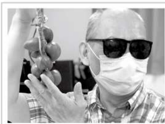
▲學員架式十足，開心展示自己親手以種子串成的花禮作品。

小小盆栽、樂趣無窮！生活中的綠意與香氣總能舒緩心中的壓力，盆栽植物已是許多人生活中的陶冶與調劑，愛盲希望透過開設盆栽創作課程，引領視障朋友走入社會，跨出步伐。以植物為媒介，學員們彼此分享盆栽照顧心得，更有學員在課堂上交到新朋友，感謝身邊有這麼多人給予鼓勵，原本害怕出門的她發現只要跨出第一步，後續就不困難了，直呼幸好當初有鼓起勇氣。