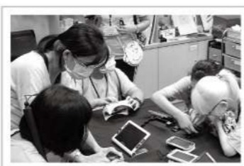
▲對初次使用者來說，輔具操作可能會一時摸不著頭緒，愛盲同仁正細心解說。

「聽見冒險的聲音」營隊的隊員們都是視障學生，營隊的其中一個重要行程，便是來到愛盲了解低視能服務的面向與方式，並接觸各式各樣不同類型的輔具。當天除了向隊員們提供輔具的試用體驗與介紹，也擇要為大家解釋輔具在不同情境中的優缺點，更為視障生準備詳細資料帶回家參考，期待在未來的人生旅途中，視障生們能夠不受視力侷限，恣意探索未來。