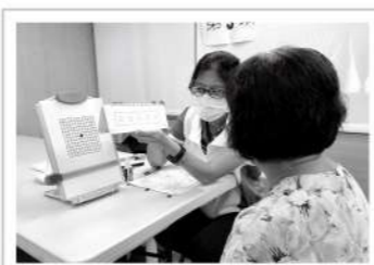
▲以表格與圖卡檢視黃斑部病變與視力對比敏感度情況。

台灣視障與低視能人口中，中高齡者一直是其中的高比例族群，為提供中高年齡長輩視力保健與衛教宣導，愛盲主動走入社區，來到新希望社區照顧關懷據點，帶著銀髮朋友們認識與年齡有關的常見眼疾、介紹實用的視覺輔具，更為長者們提供視覺功能快篩服務，希望藉著社區關懷據點的服務機會，為民眾提早發掘眼睛的隱憂，預防視覺障礙的發生。