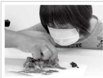
▲課堂上老師也會讓學員們以觸覺、嗅覺等方式輔助記憶。

許多人喜歡將中藥運用於日常生活之中，但中藥成分複雜，寒熱屬性各有不同，因此若亂服中藥或飲食不忌口，可能反而對身體造成傷害，愛盲開辦生活中藥應用班，希望幫助視障朋友了解中藥的屬性、功能與禁忌，建立正確觀念，在使用上更加安全謹慎，並化被動為主動，為自己建立更健康的觀念，善待自己的身體。