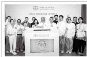
▲愛盲基金會「護盲國家隊-企業組」成軍。

頂呱呱、喜鋪、印花樂、橘子工坊、艾瑪絲、六月初一、台灣好農、天喜台北搬家、鯨讚、書寶二手書店等十大企業齊聚，希望能拋磚引玉帶動社會大眾發揮愛心精神，為視障朋友在黑暗徬徨的時刻點亮勇敢前行的道路。