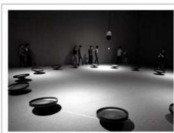
▲視障朋友在引導下聆聽浪聲節奏起伏與變化。

視覺並不是欣賞藝術的唯一方式，而探索藝術的途徑，也不應該因為視力或其他障礙而受到限制，國立臺灣美術館推動文化平權，將展覽融入通用設計，讓不同障別的朋友們也能自在欣賞藝術，今年愛盲基金會便與國美館合作，帶著視障朋友一同以各種感官體驗看展的樂趣，在專業導覽員的帶領下，視障朋友們善用聽覺、嗅覺探索其中的藝術創作、與創作者的作品進行互動，找到屬於自己的感動與力量。