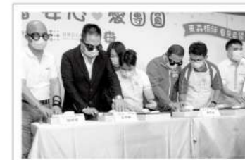
▲貴賓們戴上模擬眼鏡，在此護員工引導下嘗試完成禮盒包裝，大膽不容易。

愛盲大家長謝邦俊也期待藉著這次機會，證明愛盲庇護員工用心製作的商品也能走入電視平台，經得起市面上商品標準及大眾的嚴格檢驗，未來愛盲也將陸續推出多樣限定手工皂組合與隱藏版茶葉果乾禮盒，展現愛盲庇護工場別出心裁的創意與用心。