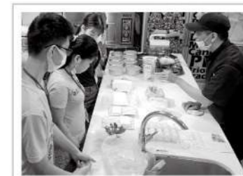
▲烘焙體驗的講師細心介紹每個製作步驟。

愛盲希望能幫助視障學生對社會職場提前有更具體的理解與想像，從包含實際撰寫履歷表、面試自己想要從事的工作等流程，認清自己所具備或欠缺的能力，並踏實地在求職地圖中，找出屬於自己可以安心立足的定位點。