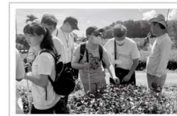
▲視障生們透過觸覺感受茶樹的樣貌。

青春就是一步一腳印留下的軌跡，而視障生在學校常因視力不便，除了本身課業，還需額外適應記憶校園每個空間位置，相較其他學生得付出更多時間去學習生活大小事。今年愛盲南區青少年夏令營，帶著視障生們暫時離家，學習獨立外出住宿，並藉此增加同儕間互相認識交流的機會，彼此傾聽對話、互助互長並一一克服挑戰，正是此次旅程中可貴難得的地方。