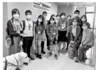
▲視障青少年職場體驗。

疫情來臨時，是對智慧的挑戰，同時也是對生活適應的考驗；北區資源中心衷心希望透過多元的重建服務內涵，能讓視障朋友在人生不同旅途的階段中，活出自信、活出光彩，從而掌握自己的人生，開創幸福。