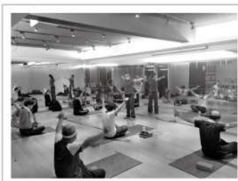
▲透過彈力帶，讓肌耐力得到充分的訓練。

對於視障朋友來說，在需要以運動維持調劑身心健康時，卻往往因在坊間找不到能夠配合視力或身體狀況調整節奏的課程，導致運動門檻大大提高，易讓身體與心理缺乏適當抒發出口，形成惡性循環。愛盲邀請視障教學經驗豐富的老師利用彈力帶、圓盤等工具燃燒卡路里，將每組動作整理成圖文解說與純文字電子檔，供學員們回家自行練習，協助視障朋友尋求健康身體之餘，為他們適時釋放心中壓力與負擔。