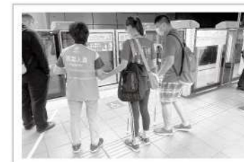
▲學會善用大眾交通運輸的引導服務與資源也是此次活動的目的之一。

跳脫舒適圈，10位視障生跟著愛盲精心規劃的雙北歷險活動，挑戰自我，練習安排規劃行程，並運用雙北市的大眾交通運輸與資源前往各景點，完成活動關卡指定任務，增進自己獨立自主與解決問題的能力。透過闖關寓教於樂，幫助視障生們重新檢視、發現自己的優缺點與可能性，愛盲也期待今年夏天的熱血經驗，都能化為視障生未來獨立外出認識世界的養分。