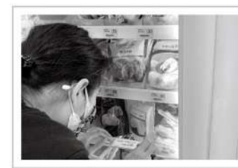
▲補貨之餘，也要細心調整商品的標籤位置，確認是否正確。

愛盲庇護工場為身障者撐起一把保護傘，員工們除了能磨練工作的技巧與能力，工場也為家屬提供一個安心信賴的場域，身障者們更能在此自食其力，為家人減輕生活負擔。愛盲希望，每個庇護夥伴最終都能發揮經驗，進入一般職場、適應社會，此次與超商合作的職場體驗，便是為了讓他們能夠模擬一般企業工作型態與節奏所規劃的前哨站。