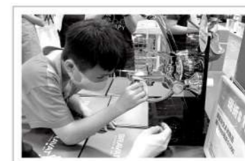
▲魔鬼氈可以將輕巧的收納盒等物品黏在牆壁或櫃檯下緣，大幅提升收納靈活性。

降低找尋物品的困擾、提升收納的效率，並維持生活場域的整潔，想必是橫跨明盲、考倒許多人的生活難題，而對視障者來說，倚賴記憶尋找判斷家中用具的能力又更顯重要。愛盲特別開辦居家輕鬆維護課程，藉由生活自理老師分享實用的收納歸類技巧，減少找不到東西的挫敗感，幫助視障者獨立自主的居家生活更加游刃有餘。