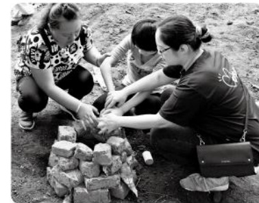
▲ 大木塊生態農園一日遊-體驗挖薯。

面對視力的喪失，對於視障者及其家人都是一個相當不容易的過程，期待透過我們的服務能帶給視障者更好的生活品質。