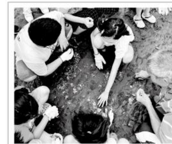
▲漁場大哥帶著視障孩子們邊觸摸邊解說潮間帶豐富獨特的生態環境。

許多視障孩子都是初次離開父母在外過夜，因此與同儕相處、外宿都是相當陌生的嘗試，往往缺乏群體相處應對的生活經驗。愛盲期許透過這次體驗，在安全、有趣的環境下，為孩子們補足這些重要的社交經驗與社會能力。