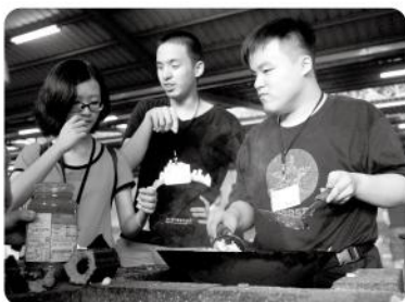
▲ 許多體驗對於視障生來說都是新鮮的首次嘗試。