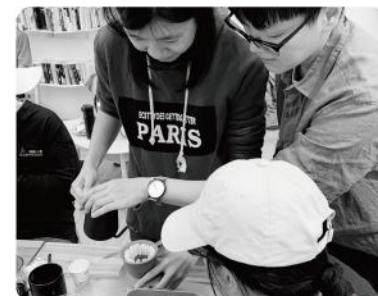
▲ 彰化手沖咖啡體驗班。