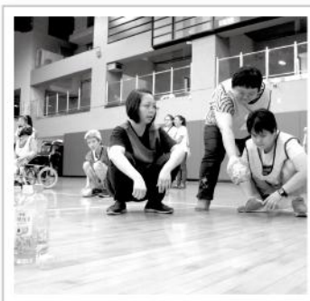
▲隊友幫忙撿球、別隊的隊員也熱心提示賣特瓶方位，齊心協力完成比賽！

運動日上不時可看到出聲協助視障者修正拋球軌跡、推著輪椅與夥伴攜手奔向終點，或是交互打氣的畫面，充分展現員工間相互幫忙的好感情與充滿風度的運動家精神。在活動中，助身障員工找到運動的熱情，更培養大家團結一心、相互合作的能力。