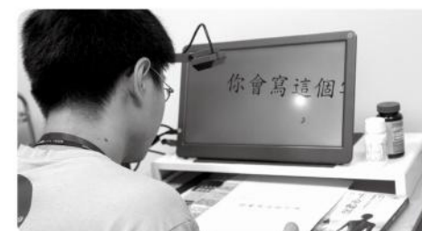
▲使用濾光眼鏡、擴視機等輔具或是其他替代視覺的方式，同樣能完成日常生活的大小事。