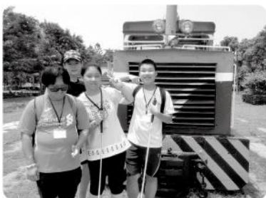
▲ 透過團體行動，學習與同儕相處的能力。