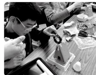
▲ 親子手作活動-組裝薑餅屋。