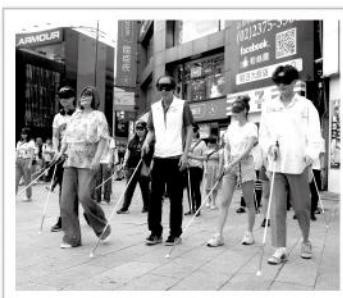
▲眾藝人依照主持人指示移動，短短幾步路便迷失方向，大呼不容易。

愛盲於西門町舉行白手杖蒙眼快閃活動，邀請多位藝人一同與現場民眾蒙眼體驗使用白手杖行走，感受視障者面對未知路況的不安；並親自示範「問、拍、引、報」推廣正確助盲步驟，呼籲社會大眾持續關注視障議題，號召更多朋友適時提供協助，化身為視障者外出行走時最暖心的風景。