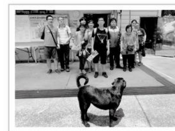
▲難得的生命教育之旅，大家也在動物之家前與浪浪合影留念。

生命教育是每個人成長過程中都需要經歷學習的重要課題，愛盲就服員精心為土城工場的30位身障員工們策畫了一場別開生面的生命教育課程，而這次為員工們上課的特別講師，便是來自動物之家的「浪浪」們，透過多元活動的設計安排，與小貓咪互動、餵食和為毛小孩洗澡等連結，愛盲希望藉由參訪動物之家的機會，讓庇護工場的員工們以突破言語的方式感受生命，進而學會愛惜自己的身體、尊重身邊人事物的同理心。