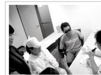
▲電話客服情境模擬討論，學習如何應對合宜地解決客訴問題。

愛盲始終不以「視力狀況」為條件遷就學生的能力與可選擇的職種，期望能帶領視障生們跳出舒適圈與既定框架，在未來投入職場前，建立正確的工作態度與求職技能。