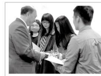
▲健康管理師授證典禮，鼓勵學員們優秀表現和積極進取的精神。

國際專業訓練暨認證委員會授權愛盲學院開課的健康管理師第一梯次證照班已經正式結業，愛盲為應屆畢業生舉辦授證典禮，期許學員們發揮專業知識持續吸收新知，不僅改善自己、還能成為幫助身邊親友、客人的傑出健康管理師。為讓學員有效學習，愛盲學院每次課堂都會整理上課情況並即時做出調整，期待愛盲學院能成為共同學習專精技職的場域，更是無障礙追求卓越成就的殿堂。