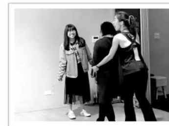
▲舞蹈動作較複雜，老師想了許多方法幫助視障者學習舞步。

舞蹈已成為近年來世界流行的運動方式，不僵化又有趣的特質大幅提高了許多人的運動意願，愛盲也發現視障者其實有學習運動課程的需求，但能夠在坊間有系統學習的機會卻不多，這次開設視障者基礎ZUMBA舞蹈班，不僅考量到視障者健身運動的需求外，也期望能豐富視障者對運動類型的想像，幫助視障者們有個適合自身學習步調的運動課程，更希望學員們在掌握正確的基礎運動方法後，能夠養成持續運動的習慣，擁抱健康樂活的人生。