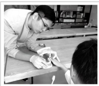
▲透過指尖感受齒模了解牙齒的排列與構造。

口腔衛生師用生動比喻介紹器材，帶視障孩子了解器材功用，並為孩子科普許多牙齒保健知識，希望能藉此機會引導他們認識自己的口腔清潔，讓一口好牙與好口氣成為孩子們其中一項良好的生活禮節。