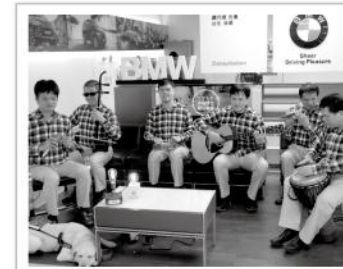
▲愛盲樂團與BMW台北依德共同號召大眾響應有愛無礙理念。

BMW台北依德以音樂會邀約、手作餅乾義賣等方式，支持著愛盲樂團，並推出暖心桌燈義賣，號召社會大眾為愛盲樂團點燃小小的希望之光，進一步認識愛盲樂團透過音樂傳達的理念，讓愛蔓延、綻放光芒！