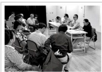
▲座談會邀請四位視障者分享自己的生命故事。

每個人都有愛與被愛的能力與需求，視障者自然也一樣，而不管你是單身達人，或是身邊有伴侶陪伴在側的朋友，在情感上的處理或多或少都一定會面臨各種大大小小的難題，對視障者而言，同樣的困擾，比起他人卻更難找到解答與傾訴的管道，因此愛盲特別邀請到四名視障講者擔任主講人，分享其情感探索經驗，呈現以視障者為主體的生命敘事。