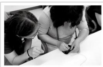
▲小幫手會在學員們進行穿針引線等工作時適時從旁協助或引導。

就算不依靠視力，視障者也能發揮創造力，運用一雙巧手展現精湛技藝。愛盲舉辦休閒皮件班，邀請視障朋友認識各種皮製手工製品，除了學習皮件的相關知識外，也引導學員親手將皮件製成鑰匙包、零錢包等實用的生活物品，培養主動嘗試不同挑戰的熱情。在面對較複雜困難的步驟時，學員們也都仍然躍躍欲試，藉著這次機會，發覺出自己更多的可能性。