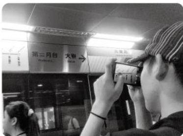
▲ 視障生透過輔具學習搭乘大眾交通運輸。