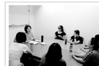
▲寫作班兩個月的相處與交心，也讓成員們彼此建立起深厚的情誼。

視障女性要承受社會上對「身障者」貼上的刻板標籤，同時也需要面對身為「女性」被加諸的種種期待與框架，卻鮮少有管道讓大眾聽見她們的心聲。愛盲於108年8月起開設為期兩個月共8堂課的「視障女性生命書寫寫作班」，並邀請7位視障女性寫下她們的生命軌跡，共同檢視視障女性的集體障礙處境，開啟一扇新的對話窗口。