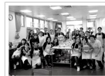
▲感謝GODIVA的夥伴們，為庇護員工留下難忘又美好的一天。

巧克力一直以來都被當作甜蜜與表達心意的象徵，而大家耳熟能詳的巧克力品牌GODIVA透過公益活動的參與，更是為巧克力賦予了不同的意義。GODIVA公益日特地來到了愛盲土城工坊，參與手工皂製皂體驗，身體力行支持愛盲身障夥伴就業，給予員工們展現自我的機會，並用心準備了巧克力棒棒糖DIY活動，在溫馨有趣的互動中，用巧克力與庇護員工們來場你儂我儂的溫暖交流，共度甜蜜蜜的幸福時光。