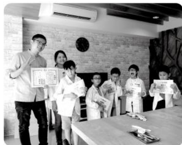
▲小小牙醫活動體驗。