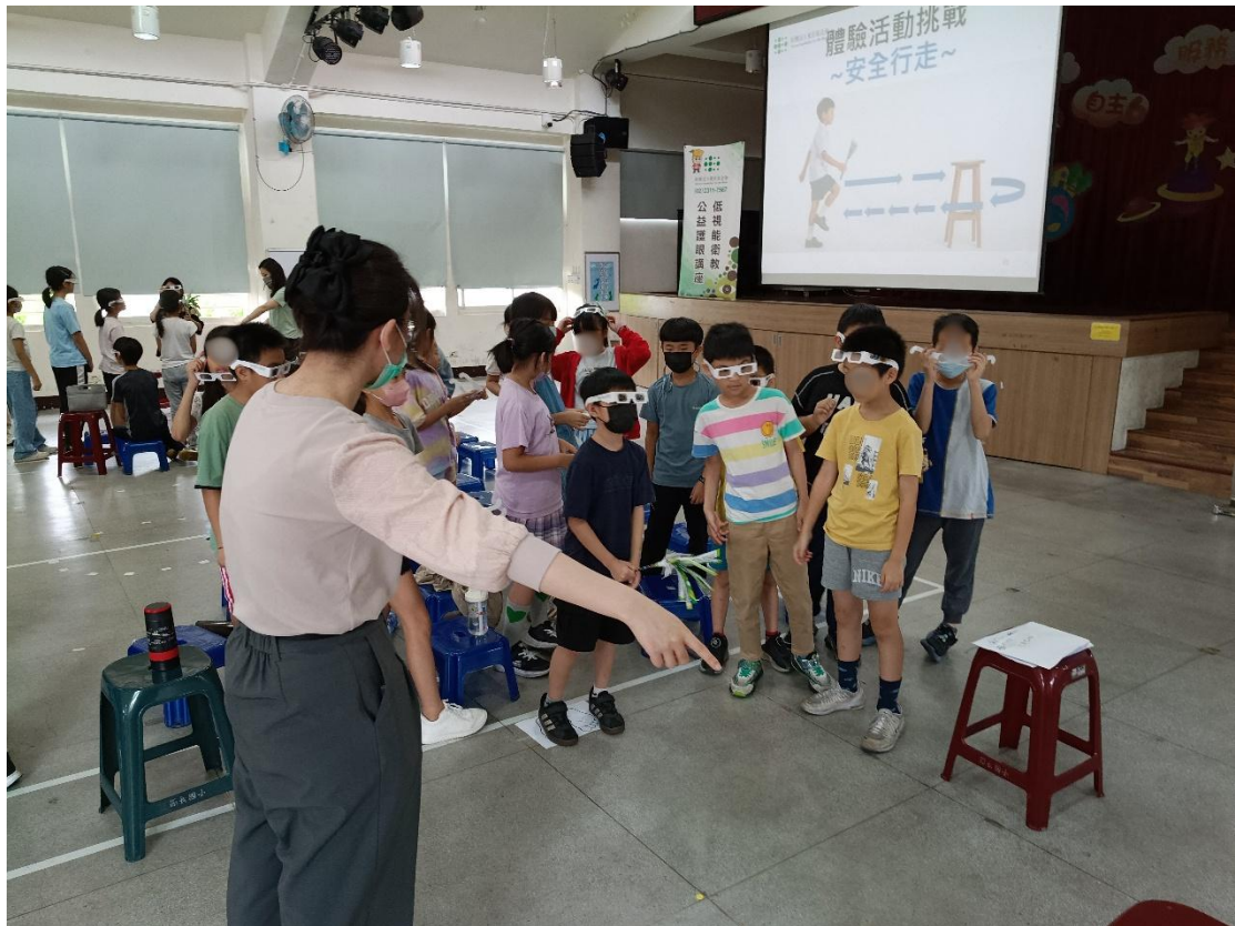
本次使用的模擬眼鏡為【 中信慈善基金會贊助 】學生們挑戰視障模擬體驗活動